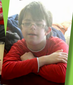
19 Octobre 2014