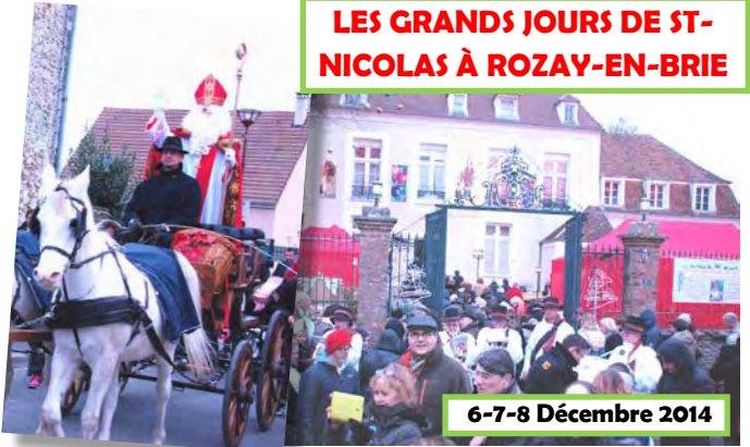
6-7-8 Décembre 2014