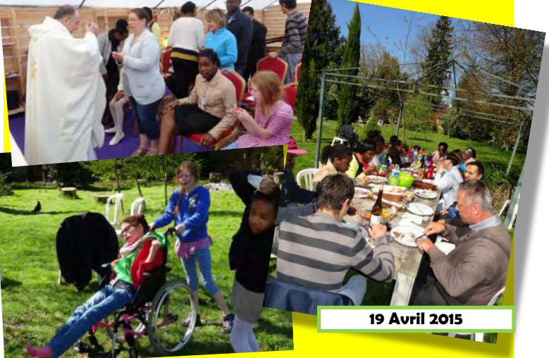
19 Avril 2015