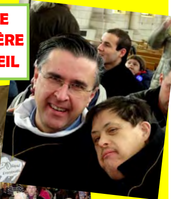
1 Février 2015