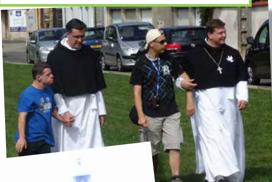
20-21 Septembre 2014