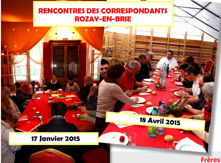
18 Avril 2015