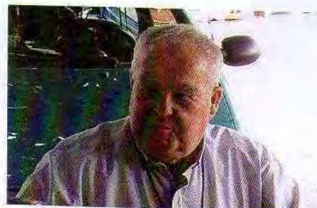
Père Joseph en retraite...