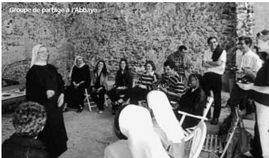
Groupe de partage à l'Abbaye

Tél. : 01 60 22 06 11 Site Internet : http://perso.wanadoo.fr/abbayejouarre/