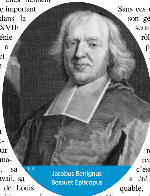
D.R. Jacobus Benignus Bossuet Episcopus