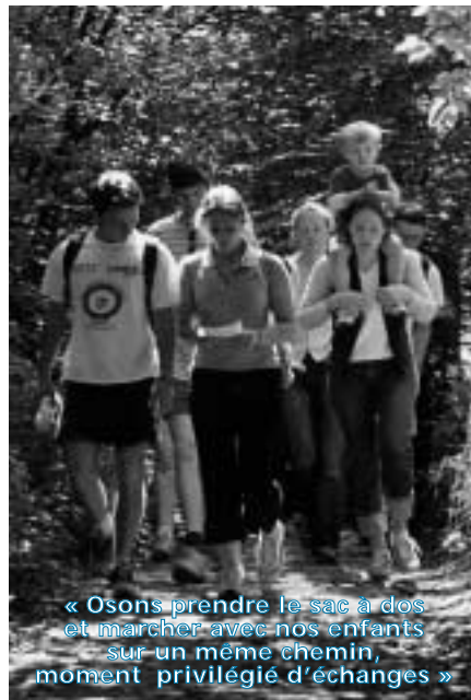
« Osons prendre le sac à dos et marcher avec nos enfants sur un même chemin, moment privilégié d'échanges »

Il y a bien longtemps que je ne me suis pas posé cette question. Alors profitons-en pour faire le point. L'idée que j'en ai, est-elle la bonne ? Qui peut m'en parler ? Il y a quelqu'un qui le connaît très bien, c'est son fils Jésus Christ. Il a dit plein de choses au sujet de son Père, vous pouvez trouver ces récits dans la bible. Lisez donc saint Marc et les Actes des Apôtres, puis regardez autour de vous, notez ce qui vous semble en cohérence avec ces textes et ce qui ne l'est pas. Vous ferez ainsi la part de la présence de Dieu dans ce monde et de l'action du mal. Voilà un moyen de découvrir ou de retrouver Dieu ? Bonnes vacances et bonnes retrouvailles !