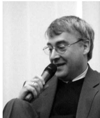
Paroles de vie