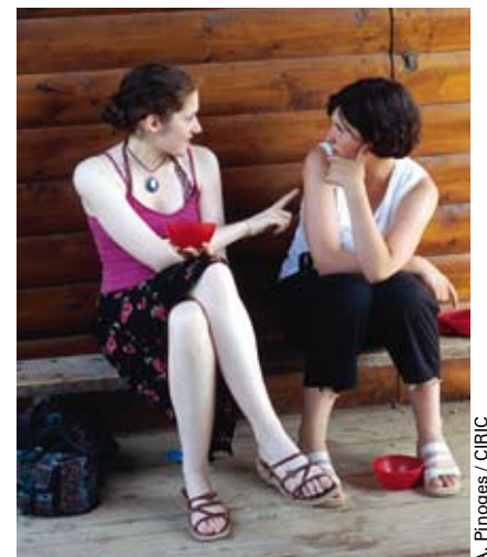
A. Pinoges / CIRIC

Profites-en, va à la rencontre des autres, partage, met-toi à leur écoute.