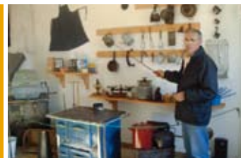
Paroles de vie