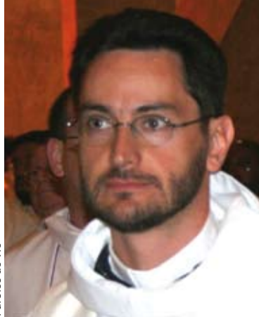
Paroles de vie

Naissance de Jésus dans la crèche il y a plus de 2000 ans mais aussi naissance d'une nouvelle présentation de votre journal Parole de Vie . Grâce aux soutiens financiers des annonceurs et de la paroisse, Parole de Vie s'illumine de couleurs et nous donne l'occasion de voir les choses différemment !