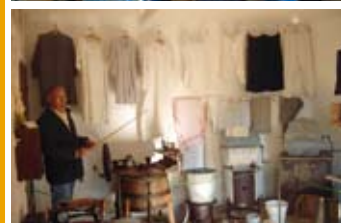
Paroles de vie