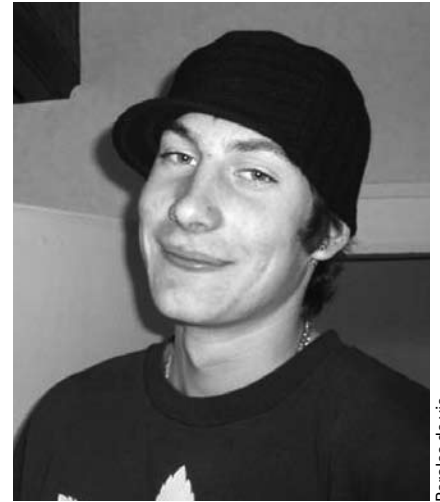
Paroles de vie