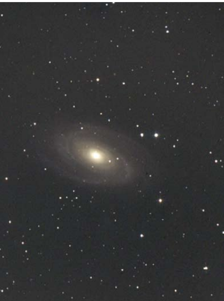
Cédric/Club Astro Bassée Montois