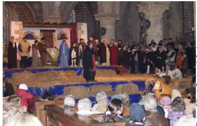
Regard sur tous les acteurs