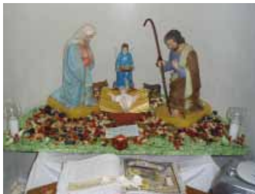
Une crèche paroissiale