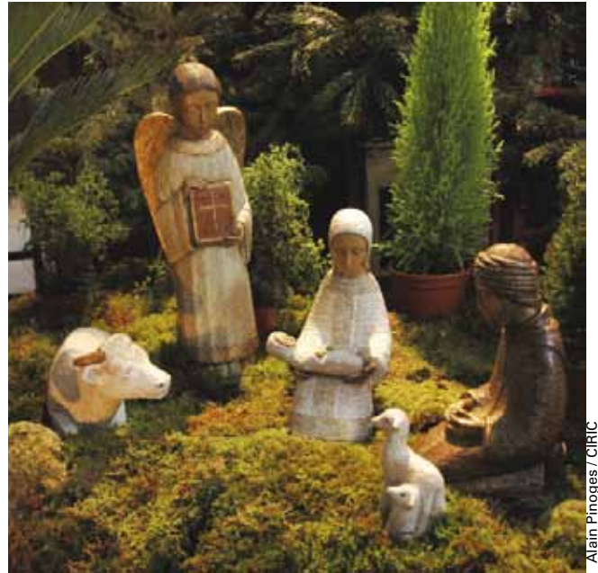
Alain Pinoges / CIRIC

La première crèche « avec personnages » remonte à 1283 et fut commandée par le pape Onofrio IV. La seconde crèche fut donnée par la reine Sancia en 1340 pour l'église des Clarisses. A Naples, les Franciscains, Jésuites, Têatins et « Scolopi » (Frères des écoles chrétiennes) diffusèrent des crèches. Les monastères rivalisèrent pour réaliser la plus belle crèche : les personnages étaient en bois et un peu moins grands