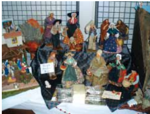
Les Santons de Provence