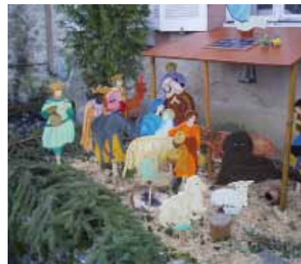
Une crèche d'extérieur