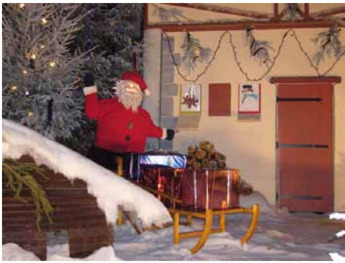
Paroles de vie