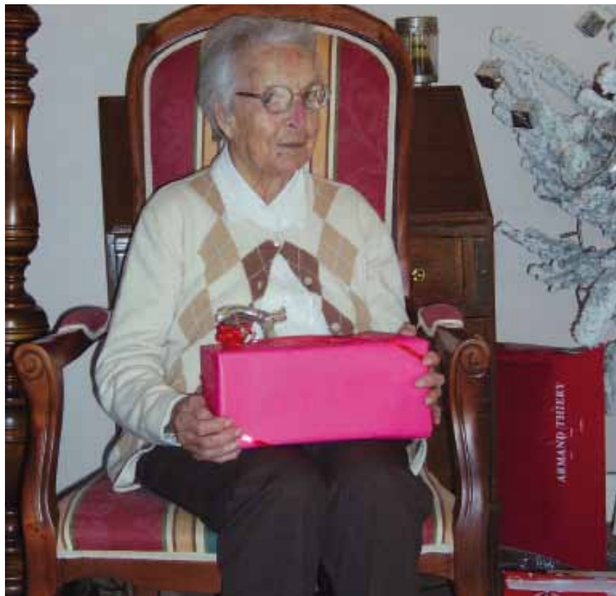
Paroles de vie

Il y a 5 ans, nous nous installons aux Ormes-sur-Voulzie avec le projet d'ouvrir notre maison aux personnes âgées. Ayant une expérience professionnelle hospitalière, je décide de solliciter le Conseil général de Seine-et-Marne pour obtenir un agrément. Me voilà partie pour une nouvelle activité : famille d'accueil pour personnes âgées. Connaissez-vous cet accueil proposé aux personnes de plus de 60 ans ?