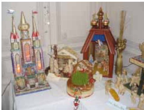
Une crèche de Russie et de Pologne