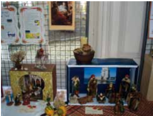
Une crèche d'Espagne et du Portugal