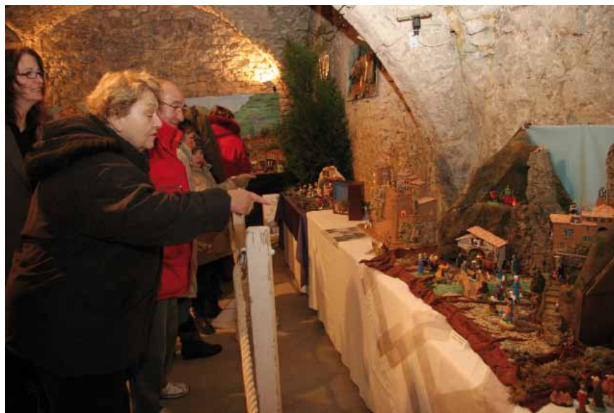
Paroles de vie

chiens de berger, les chameaux des rois mages, sans oublier les chants de Noël, font revivre l'histoire de la Nativité : crèche pleine de ferveur, de foi et de poésie.