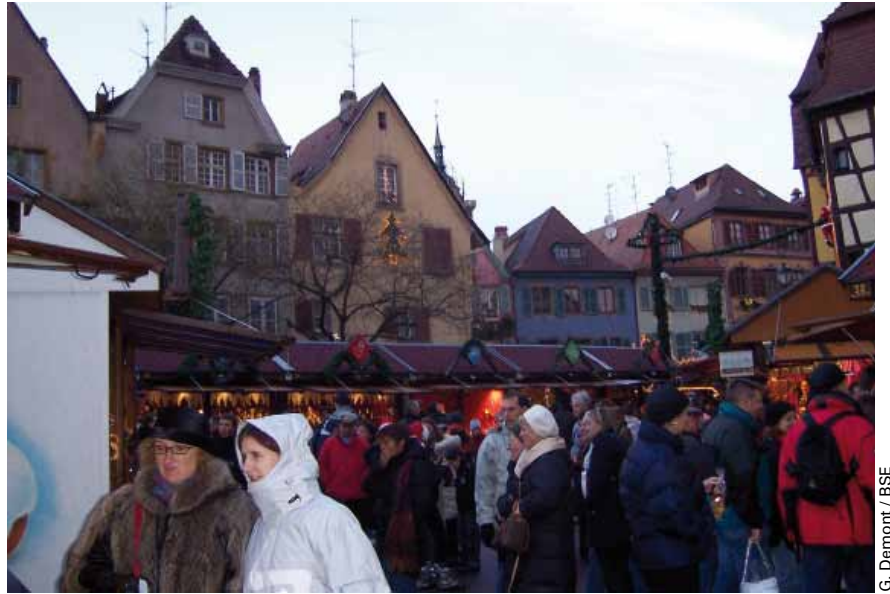
G. Demont / BSE

La tradition des marchés de Noël remonte officiellement aux années 1570 mais leur existence est bien plus ancienne. On fêtait alors saint Martin et saint Nicolas.