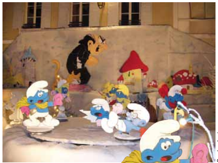
Paroles de vie