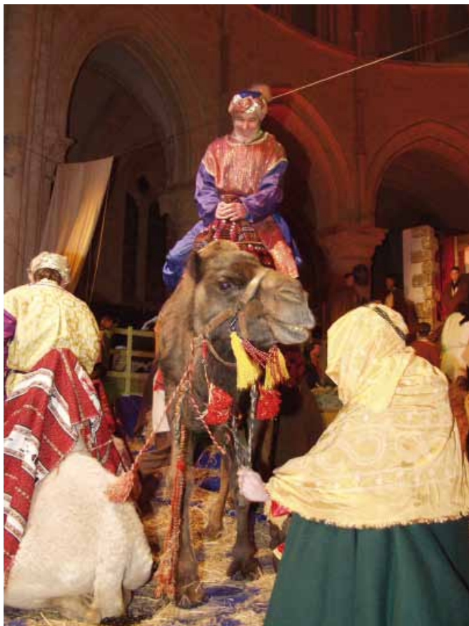
L'arrivée des rois mages