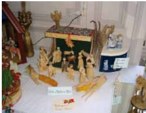
Une crèche de Tchèque