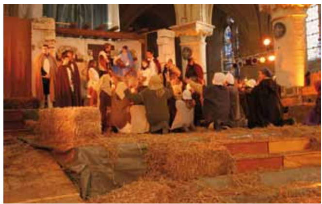
L'adoration des bergers